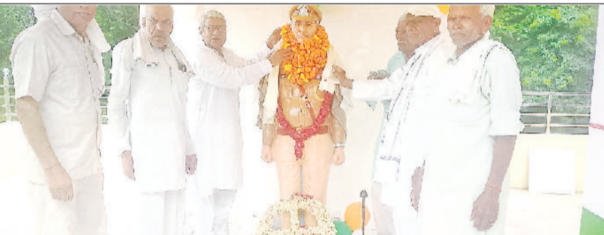
नारनौल। शहीद की मूर्ति पर माल्यापण करते मौजीजान।

शहीद देश के आइकन होते हैं। उनकी स्मृति में स्थापित करना, समारोह, मेले, खेल प्रतियोगिता, भंडारे तथा जागरण आयोजित करना सराहनीय कार्य हैं। शहीदों तथा उनके परिवारों का सम्मान करना समाज का कर्तव्य है।