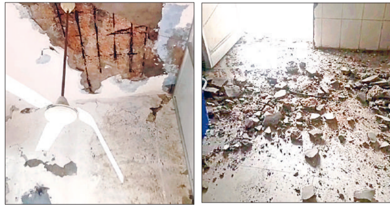
नारनौल। वह छत जिसका प्लास्टर गिरने से पंखा हुआ क्षतिग्रस्त व जन औषधि केंद्र के फर्श पर बिखरा पड़ा माल।

यहां बात दें कि करीब दो साल पहले नागरिक अस्पताल के गायनी वार्ड की छत का प्लास्टर भी गिर गया था। अस्पताल के इस पुराने भवन की दीवारों और छज्जे पर पौधे उग आए हैं, जो अब बड़े होते जा रहे हैं। इससे भवन को नुकसान पहुंच रहा है। इतना ही नहीं छज्जों का प्लास्टर भी गिरता रहता है। जहां से भी प्रतिदिन मरीजों की आवाजही रहती है। इस समय बारिश के सीजन में ज्यादा खतरा बना हुआ है।