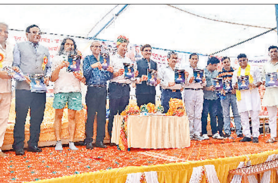
नारनौल। स्मारिका का विमोचन करते अतिथि।