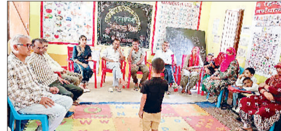
नारनौल। प्राथमिक स्कूल में आयोजित होती अभिभावक शिक्षक बैठक

शिक्षा विभाग की ओर से जिला के सभी 455 प्राथमिक विद्यालयों में अभिभावक-शिक्षक बैठक का आयोजन किया गया। इसमें ग्रौष्मकालीन अवकाश के दौरान बालवाटिका-III से कक्षा पांचवी तक के विद्यार्थियों को दिए गए रचनात्मक एवं व्यवहारिक गृहकार्य का मूल्यांकन किया गया। ज्ञात हो कि ग्रौष्मकालीन अवकाश के दौरान विद्यार्थियों को अनुभव आधारित गृहकार्य दिया गया था। जिससे न केवल उन्हें वास्तविक जीवन से जुड़ने का मौका मिला बल्कि उनकी रचनात्मकता, स्वायत्तता और जिज्ञासा को भी प्रोत्साहन मिला। इस गतिविधि आधारित कार्य को विद्यार्थियों को अपने परिवार के बड़े सदस्यों के सहयोग से पूरा