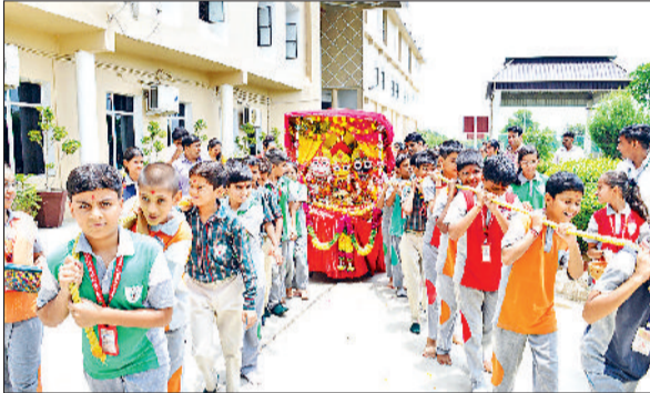
नारनौल। रथयात्रा में शामिल होते हुए।

नांगल चैधरी रोड स्थित हरियाणा पब्लिक स्कूल में शनिवार को आषाढ शुक्ल दशमी के अवसर पर भगवान जगन्नाथ, बलभद्र व बहन सुभद्रा की रथ यात्रा का आयोजन किया गया। उड़ीसा के पुरी में वर्षों से निकाली जा रही रथयात्रा का नारनौल शहर में धूमधाम से आयोजन किया गया।